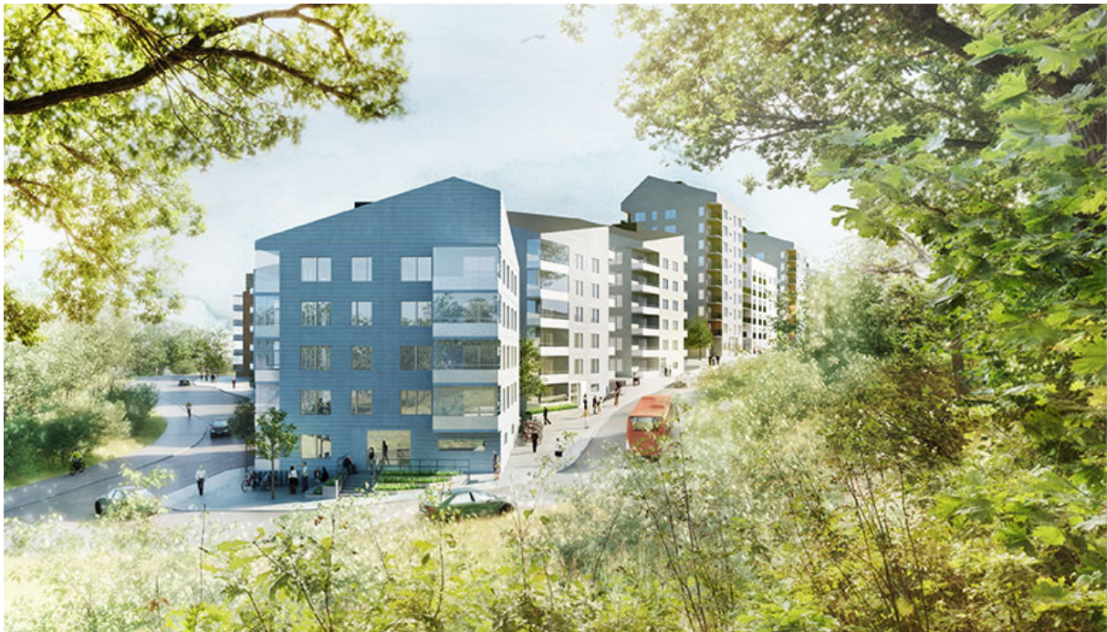
Visionsbild, etapp 1