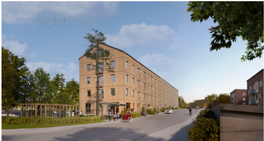
Bild 2. Illustration som visar hur Hus A ser ut i förhållande till omgivande natur och bebyggelse.

I det södra planområdet föreslår detaljplanen ett vinklat lamellhus med tre våningar, samt en fjärde indragen våning på den västra sidan. Den södra delen av byggnaden, som vetter mot parken, har en suterrängvåning. Totalt inryms cirka 92 studentbostäder i byggnaden.