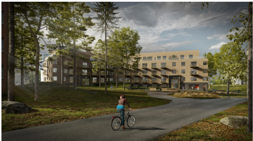
Bild 3. Illustration för byggnaden i det södra planområdet, sett från angöringsvägen.

I det södra planområdet föreslår detaljplanen ett vinklat lamellhus med tre våningar, samt en fjärde indragen våning på den västra sidan. Den södra delen av byggnaden, som vetter mot parken, har en suterrängvåning. Totalt inryms cirka 92 studentbostäder i byggnaden.