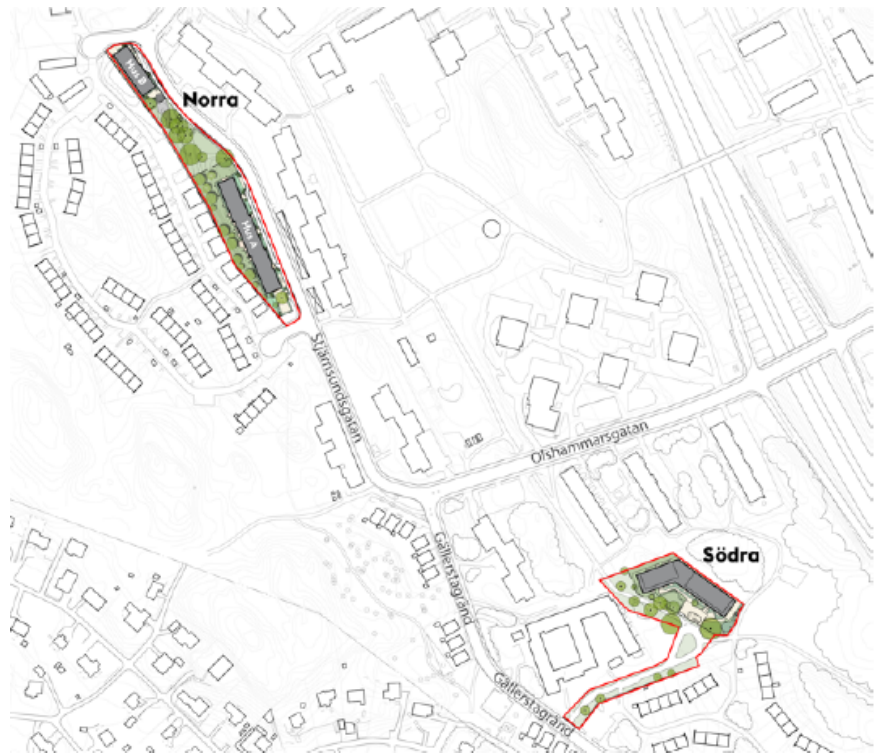
Bild 1. Norra och södra områdena från detaljplanen.

Stadsbyggnadskontoret har arbetat fram ett förslag till detaljplan som möjliggör bebyggelse av tre flerbostadshus med totalt cirka 240 studentbostäder på två olika platser i Ormkärr, som ligger i stadsdelen Hagsätra. I bild 1 nedan är de två platserna utmarkerade som Norra och Södra. Detaljplanen ingår i etappområdet Hagsätra centrum från stadsutvecklingsprojektet Fokus Hagsätra- Rågsved.