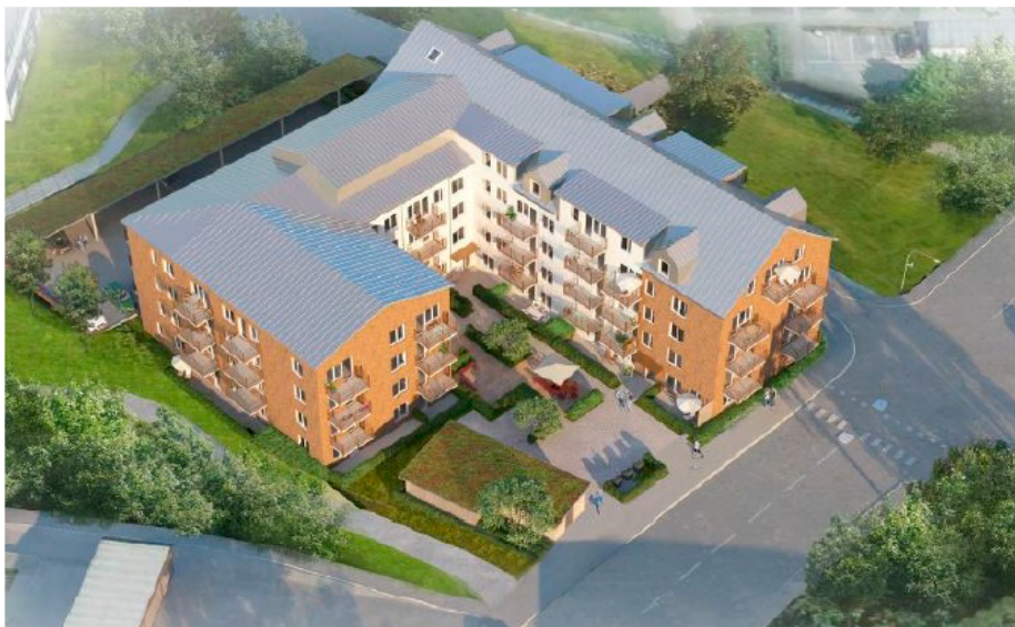
Vy över byggnaden från väster. Illustration: ÅWL Arkitekter.