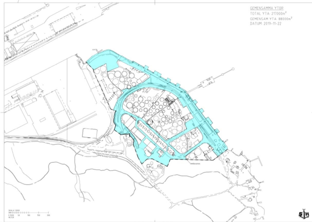
De gemensamma ytorna på Loudden (ljusblå)

Förhandlingen om ansvarsfördelningen för saneringen av de gemensamma ytorna startade 2019 och parterna tog fram olika kostnadsberäkningar för saneringen samtidigt som ansvaret för föroreningarnas ursprung diskuterades.