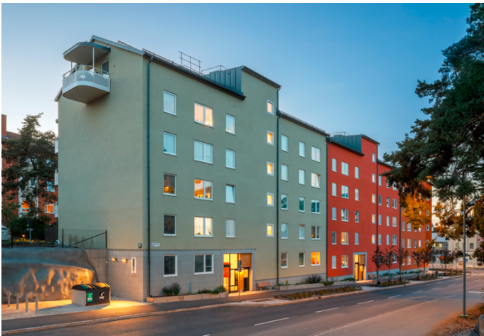
Bild: Bebyggelse sedd från Trollesundsvägen