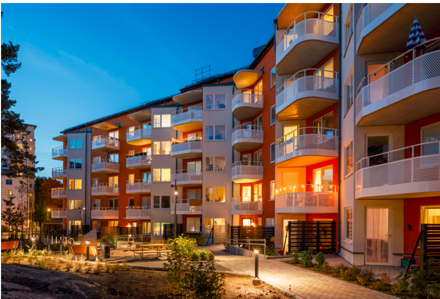
Bild: Bebyggelse sedd från gårdssidan, från Familjebostäders befintliga fastighet