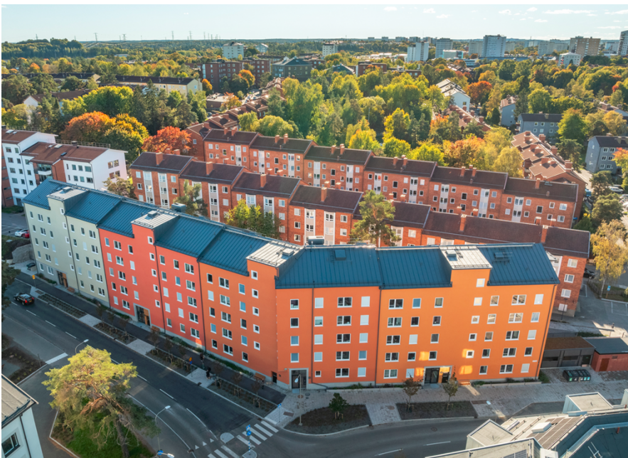
Bild: Bebyggelse sedd från Grycksbovägen