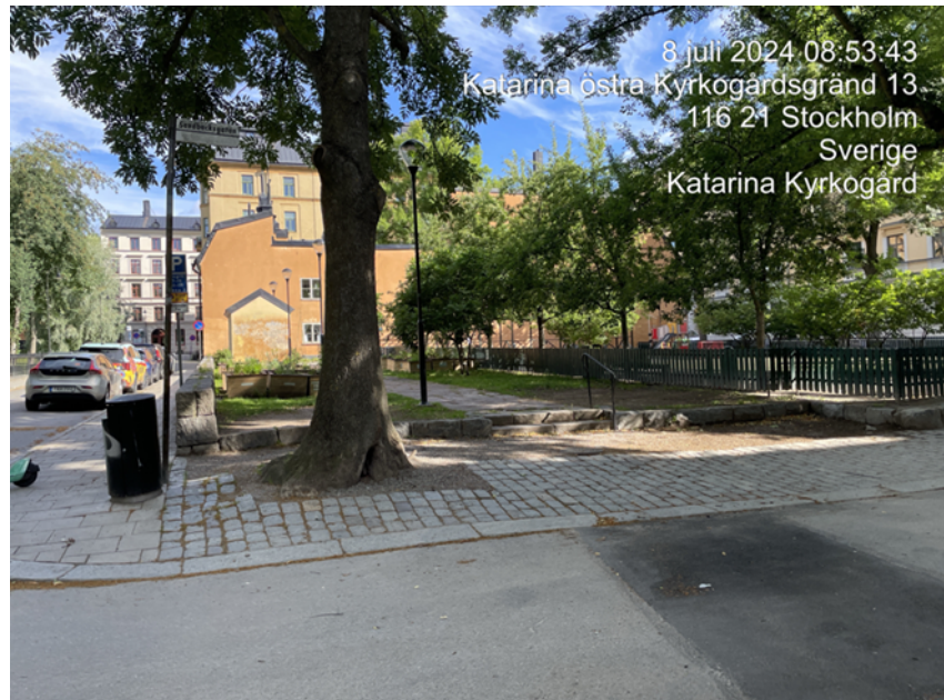
Bilden visar Sandbacksparken sydvästra hörn, mot Sandbacksgatan, där den i skrivelsen omnämnda trappan leder upp till Malin Matsdotters Örtagård.

Enligt Stadsmuseet är flera delar i parken särskilt värdefulla, bland annat den aktuella granittrappan som leder upp till örtagården från Sandbacksgatan och gångvägen som löper längs med parkens västra del. Parken omges vidare av bebyggelse med höga och mycket höga kulturhistoriska värden och ligger inom fornlämning L 2015:7789. Parken är även del av värdekärnan Katarinaberget inom riksintresset för kulturmiljövården Stockholms innerstad med Djurgården 1 .