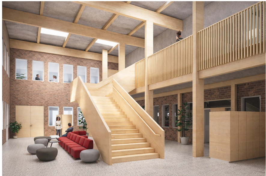
Illustration över Ljusgård 2 med ny interntappa och entresolplan (Henning Larsen).

En ytterligare förbättring sedan inriktningsbeslutet är att Ljusgård 3 inte längre byggs igen med ett nytt mellanbjälklag. Genom en mer effektiv användning av ytor och justerad placering av arkivfunktionerna har ytan i stället utvecklats till en öppen och ljus mötesplats med intilliggande mötesrum och pentryutrymmen. Det tidigare planerade mellanbjälklaget höjs i stället upp och blir en träkonstruktion i nivå med taket samt förses med ett fönsterband, vilket ger ett generöst dagsljusinsläpp och skapar en tydlig mötespunkt i byggnaden.