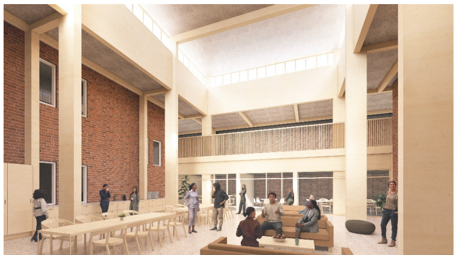
Illustration över Ljusgård 3 (Henning Larsen).

En ytterligare förbättring sedan inriktningsbeslutet är att Ljusgård 3 inte längre byggs igen med ett nytt mellanbjälklag. Genom en mer effektiv användning av ytor och justerad placering av arkivfunktionerna har ytan i stället utvecklats till en öppen och ljus mötesplats med intilliggande mötesrum och pentryutrymmen. Det tidigare planerade mellanbjälklaget höjs i stället upp och blir en träkonstruktion i nivå med taket samt förses med ett fönsterband, vilket ger ett generöst dagsljusinsläpp och skapar en tydlig mötespunkt i byggnaden.