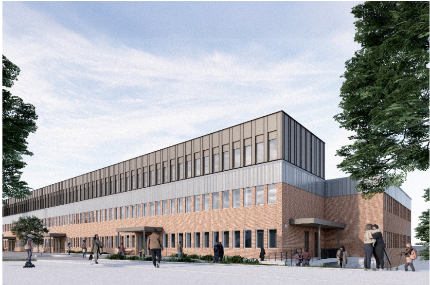
Illustration över påbyggnaden (Henning Larsen).

En ombyggnad av takplanet, bakom påbyggnaden, kommer genomföras i syfte att tillskapa en attraktiv uteplats för medarbetarna. Delar av den exteriöra miljön inom fastigheten, ursprungligen anpassad för skolverksamhet, kommer omarbetas. Den norra delen av fastigheten utgör i dagsläget grönytor och kommer fortsättningsvis vara grönyta.