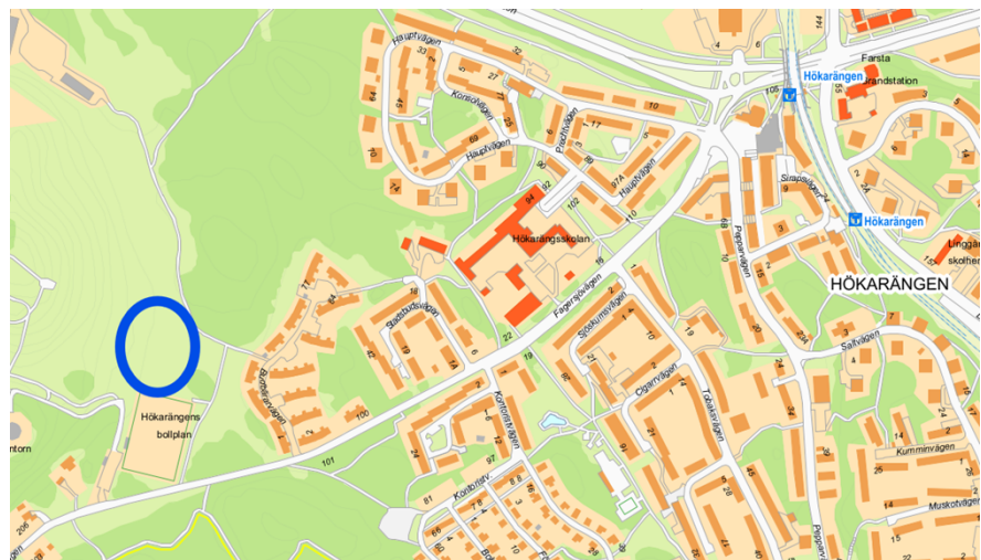
Läget för pulkabacken i Hökarängen markerat med blå oval