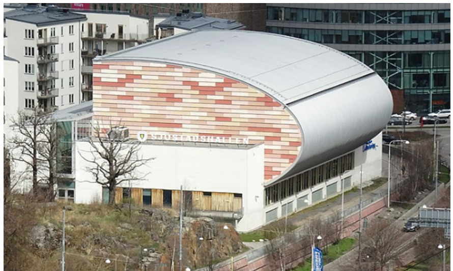
Sjöstadshallen sett från söder.

Sjöstadshallen invigdes år 2005 och är belägen i stadsdelen Hammarby sjöstad. Hallen består av tre våningsplan med en idrotts-hall överst, en före detta gymlokal på mellanplanet och parkeringsgarage i markplanet. Mellanplanet har hyrts ut till ett privat gymföretag som nu har flyttat ut från lokalerna. Gymlokalen har hyrts ut som en rå yta, det vill säga utan vare sig väggar eller ytskikt, vilket hyresgästen själv har stått för. De omklädningsrum som tidigare hyresgäst har lämnat kvar saknar tätskikt och behöver därför rivas i sin helhet.