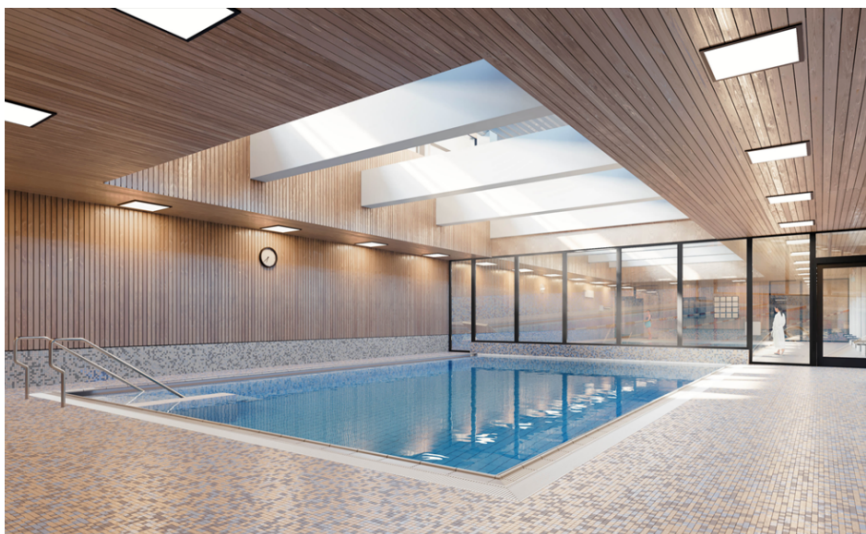
Illustration av den nya undervisningsbassängen.

Vällingby sim- och idrottshall genomgår en omfattande ombyggnation där hela anläggningen rivs till stomrent för att därefter återuppföras. För att möta verksamhetens behov och dagens myndighetskrav ersätts hus 5 med en ny byggnad i fyra våningsplan. Verksamheterna renodlas med funktioner som omklädningsrum, gym och gruppträning fördelade per våning. En ny undervisningsbassäng tillkommer, både den befintliga och den nya undervisningsbassängen kommer få höj- och sänkbar botten.