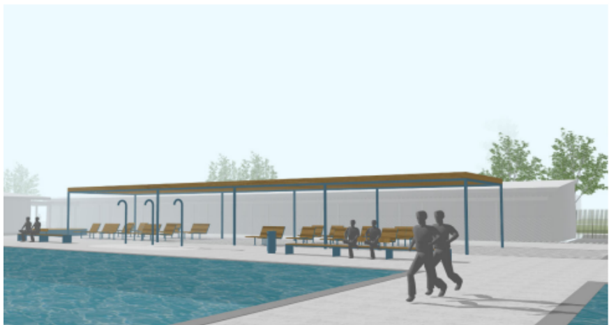
Bassäng som ramas in av bänkar, solstolar och soltak i bakgrunden.

Projektet medför en bättre arbetsmiljö samt fler funktioner för besökare och förbättrad helhetslösning för anläggningen. Befintliga teknikutrymmen för vattenrening ersätts och utökas med målet att öka kapaciteten och att minska driftkostnaderna. Anläggningen kommer att få tempererade bassänger och samtliga bassänger får stålutförande. Barnbassängen ersätts i ett något justerat läge.