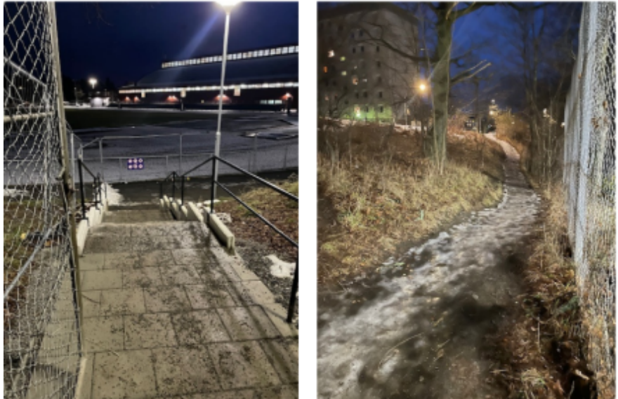
Figur 1. Trappan från Sättra IP och gångvägen mot parkvägen och gatan

Förslagsställaren lyfter också att många barn/ungdomar föredrar denna väg mellan Sättra IP och Bredäng centrum - då den upplevs som säkrare - än vägen från Sättra IPs huvudentré till Sättra centrum.