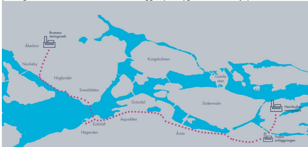
Den nya tunneln mellan Bromma och Sickla

Tunneln har en total sträckning på 14 km, se bild, och ligger på ett djup som går från -27 meter i anslutning till Bromma reningsverket till -46 m i anslutning till Sicklaanläggningen, undantaget i passagen under Mälaren där tunneln ligger på drygt 90 meters djup.