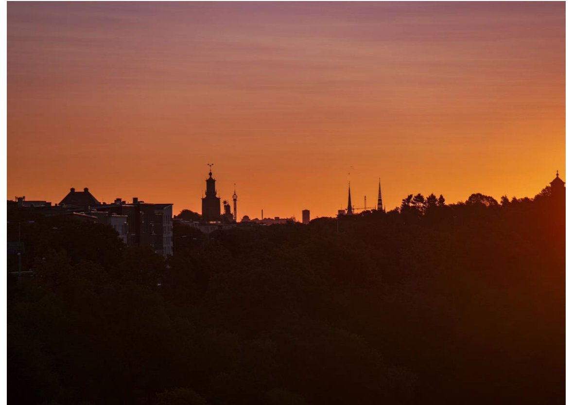
Stockholms stad mediabank