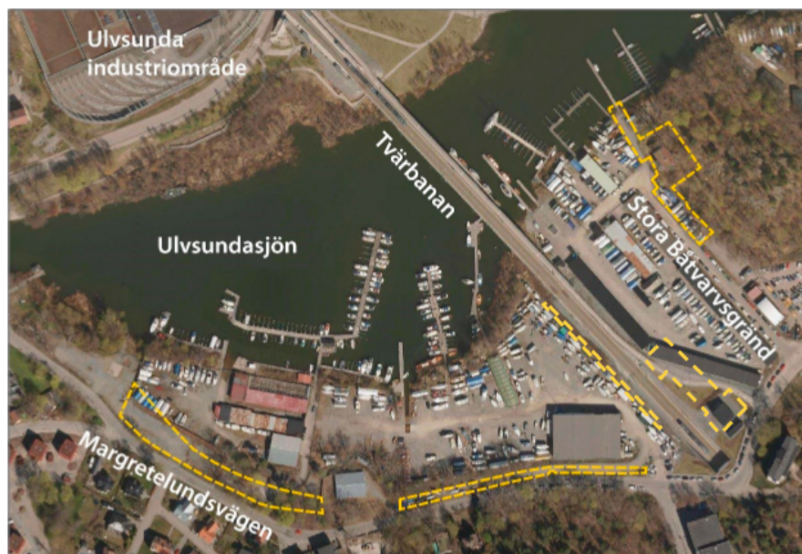
Ungefärligt planområde markerat med gulstreckad linje

Kommunfullmäktige godkände 2009-06-15 avtal med AB Storstockholms Lokaltrafik och Stockholms läns landsting rörande genomförandet av Tvärbana Norr. Kommunfullmäktige antog 2010-02-01 detaljplanen 2006-06219-54 vilken anger att den västra delen av Margretelundsvägen skall omvandlas till parkmark, samt att ytan norr om denna del skall bli park.