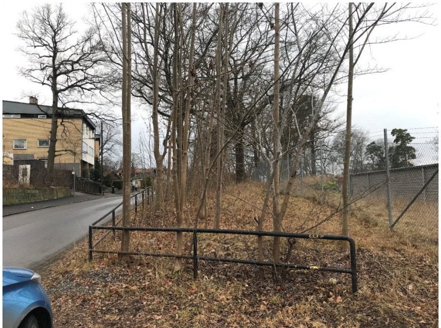
Parkmarkens funktion som spridningskorridor och visuellt skydd mot båtuppläggningsplatsen.

Bromma stadsdelsförvaltning Avdelning Administration