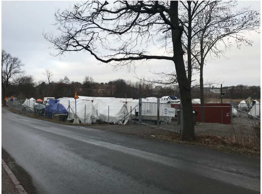
Båtuppläggning nära gatan.