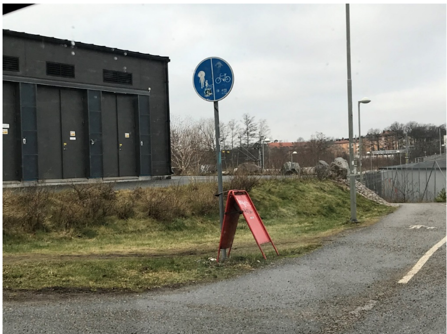
Ny plantering i anslutning till Tvärbanans bro.

I samband med att Tvärbanan drogs genom området uppläts parkmark tillfälligt till båtklubben som båtuppläggningsplats. Att det nyttjandet fortfarande kvarstår, trots att det var en tillfällig lösning, ser stadsdelsförvaltningen negativt på. Det är därför inte ett incitament som medger en justering av markanvändningen och att därmed inskränka på park- och gatumarken.