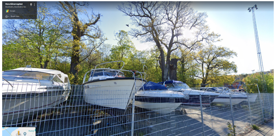
Ekmiljö vid Stora Båtvarvsgränd.

Det framkommer inte heller av underlaget att park- och gatumarken utmed Margretelundsvägen är nödvändig vintertid i form av teknisk yta för snövallar samt som avrinningsyta för dagvatten eftersom den motsatta södra sidan av gatan består av en gångbana.