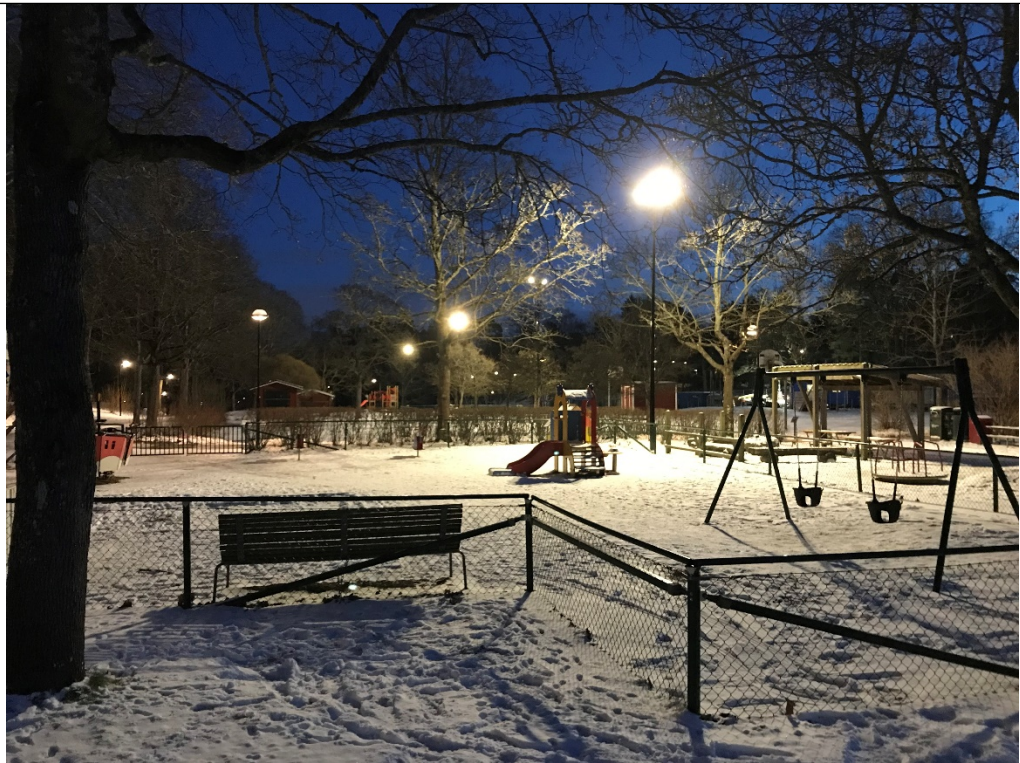
Infoga bilder från plats efter trygghetsinvestering.