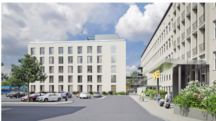
Illustration av den nya byggnaden. Bild: Archus