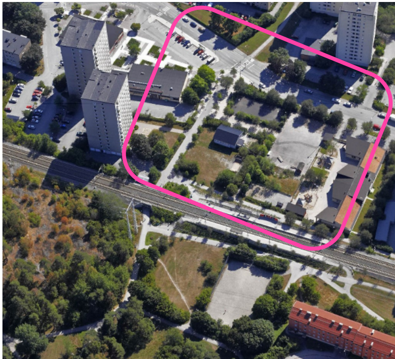
Vy över planområdet och omgivningen norrifrån med ungefärligt planområde i inringat i rosa.