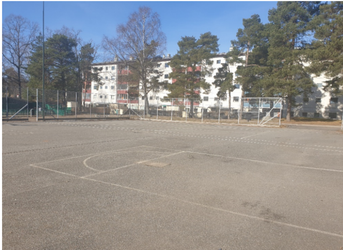
Bild av basket- och fotbollsplan tagen från öst

Förslagsställaren föreslår i medborgarförslaget upprustning av Stamparkens basket- och fotbollsplan som i dagsläget även innehåller en tennisplan. Enligt förslagsställaren används inte tennisbanan tillräckligt och anser att en padelbana skulle öka motionsintresset för äldre barn/ungdom samt vuxna i området.