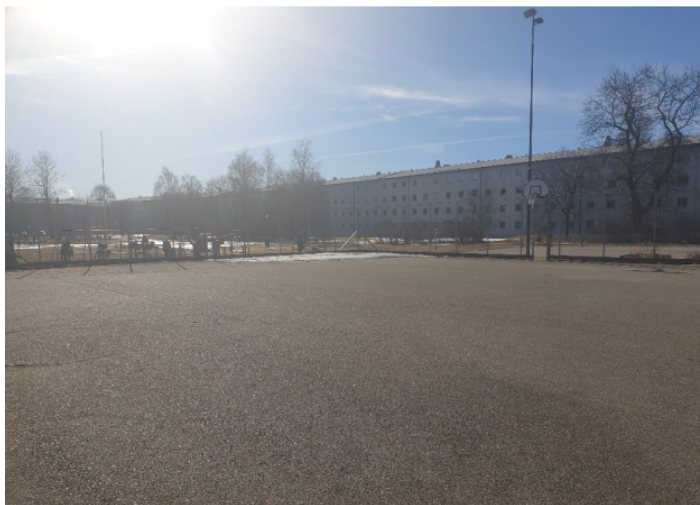
Bild av basket- och fotbollsplan tagen från väst

Alternativt föreslår förslagsställaren en fotbollsrink med konstgräs och önskar generellt att planen som den ser ut i dagsläget rustas upp.