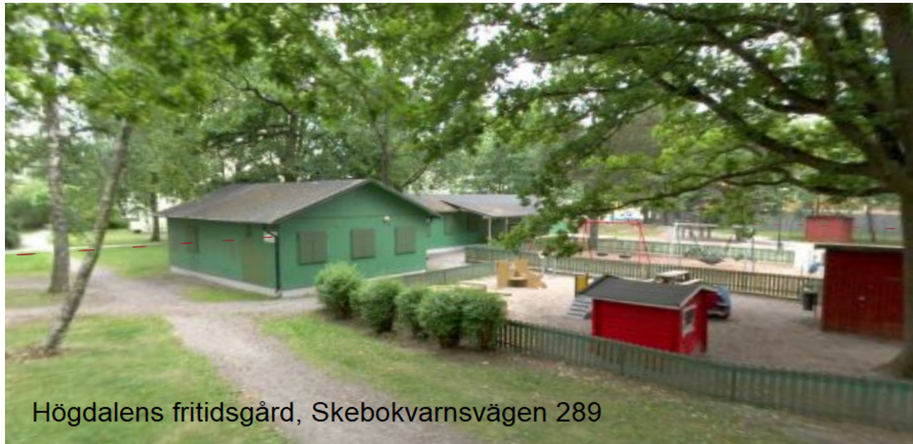
Högdalens fritidsgård, Skebokvarnsvägen 289

Installation av fyra armaturer på fasadens baksida, fyra mot parksidan samt en vid "lekhus".