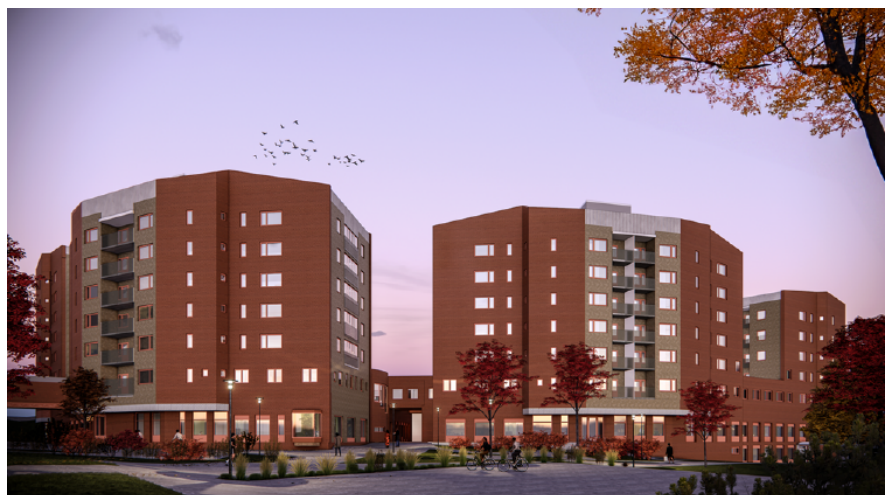
Bild 3. Illustration som visar hur byggnaderna och angränsande utemiljöer kan komma att se ut, med perspektiv från Rågsveds aktivitetspark. Källa: Stadsbyggnadskontoret 2023.

De större förändringarna på byggnaderna från planförslaget sker invändigt, men fasader, bottenvåningar och utemiljöer påverkas också till viss del. Det handlar framförallt om att det i planförslaget ställs krav på entréer och glaspartier i bottenvåningar och enligt planförslaget kan detta bidra till en tryggare och mer upplevelserik stadsmiljö. Det är särskilt mot Rågsveds centrum och Rågsvedsslingan som mer publika lokaler föreslås inrymmas, med bland annat medborgarkontor och möteslokaler.