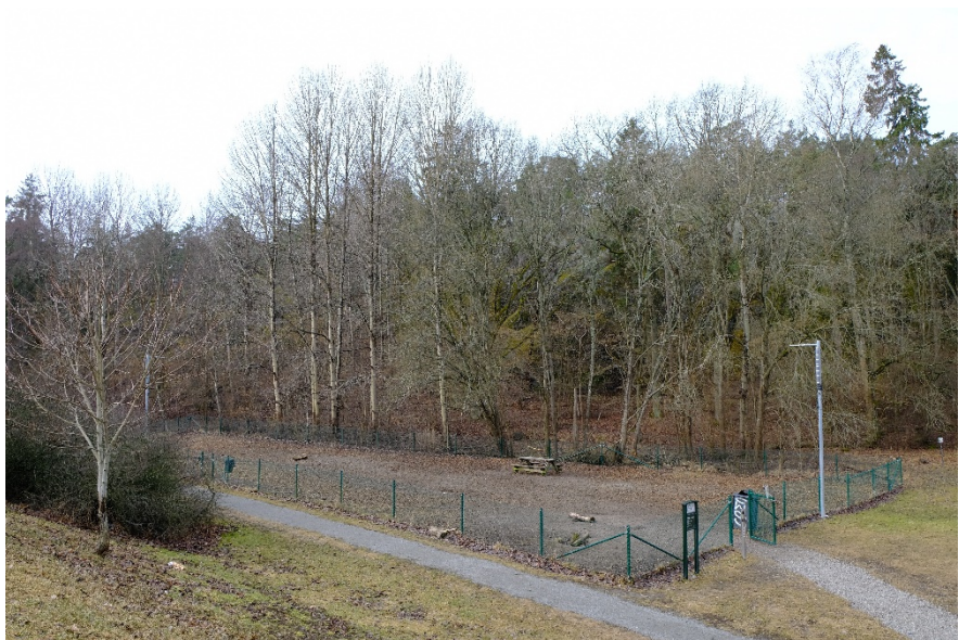
Bild 2. Sockenplans hundrastgård och skogsytan mellan hundrastgården och bergsväggen som nämns i medborgarförslaget.

Avslutningsvis anser förslagsställaren att hundrastgårdens två lyktor är ett bra initiativ, men att de är för svaga, har för kallt ljus och är felriktade. Mot det som bakgrund efterfrågar förslagsställaren starkare ljus med större räckvidd och att ljuskällorna helst har varmare ljus.