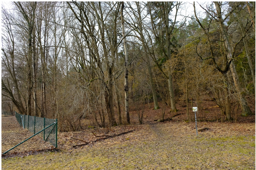
Bild 3. Skogsytan väster om hundrastgården med en upptrampad stig från parken.

Förslaget om att utöka hundrastgården västerut mot bergväggen bedömer förvaltningen inte är lämpligt. Ytan mellan bergväggen och hundrastgården består av en öppen skogsyta med upptrampade stigar och förvaltningen vill inte ta detta i anspråk och stängsla av för att utöka hundrastgården. Hela Hemskogen är ett hundrastområde, så för de hundägare som vill ha större ytor hänvisar förvaltningen dit.