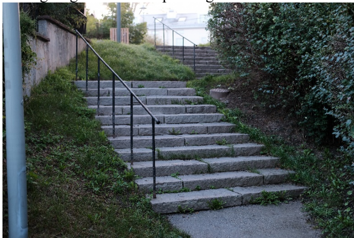
Bild 2. Trappor utmed Gåsingevägen.

Förvaltningen vill inleda med att tacka för medborgarförslaget. Det är ungefär sju meters höjdskillnad mellan Turingevägen och Gamla Huddingevägen vid Gåsingevägen. För att det ska vara möjligt att gå mellan vägarna finns det tre trappor utmed delen av Gåsingevägen som är en parkväg.