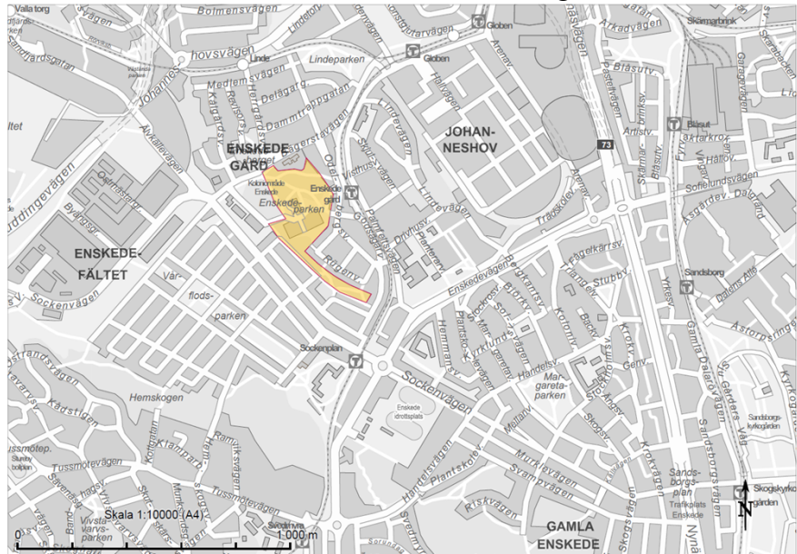
Bild 1. Karta där berörd parkmark från medborgarförslaget har markerats ut.

vägen utmed Rugenvägen. Detta skulle göra området tryggare och mer tillgängligt enligt författaren. Samtliga tre platser ligger i närheten av varandra inom stadsdelen Enskede gård.