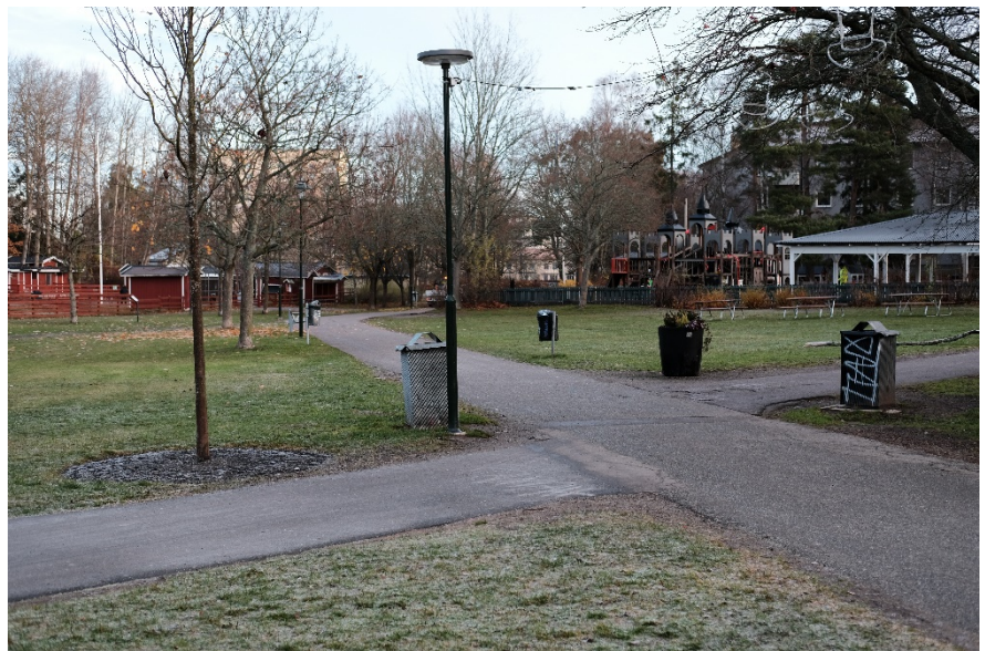
Bild 3. Parkvägen vid Bandängens parklek.

Förvaltningen bedömer trots det att det finns platser som kräver särskild omsorg, för att säkerställa att cykeltrafik inte har en negativ inverkan på barn och ungas trafiksäkerhet på en lokal nivå. Bandängens parklek är en sådan plats, eftersom den delas upp i två områden av parkvägen, och många yngre personer korsar den för att ta sig mellan dem. Detta ställer krav på cyklister att anpassa sin framfart till barn och deras ibland oberäknliga rörelsemönster. Parkvägen bör vara utformad för att minimera potentiella konflikter, missförstånd och kollisioner mellan cyklister och fotgängare.