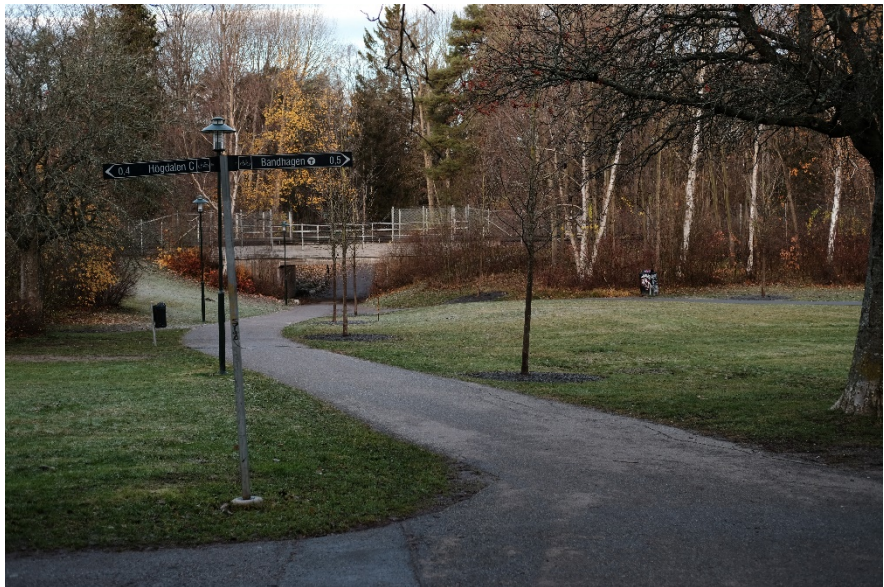
Bild 2. Vägvisningsskyltar och parkväg under tunnelbanespåret från Bandängen.

Stadens cykelplan har rekommendationer om att en dubbelriktad cykelbana i huvudnätet ska vara minst 2,5 meter, och enligt stadens dokument Planera för gående bör en gångbana med låga eller mycket låga flöden vara minst 2,5 meter. För att tillmötesgå rekommendationerna från båda styrdokumenterna skulle parkvägar som är del av huvudnätet behöva vara minst 5 meter breda. Parkvägarna från medborgarförslaget är cirka 3,2 meter breda, vilket är en normal bredd på parkvägar i stadsdelsområdet.