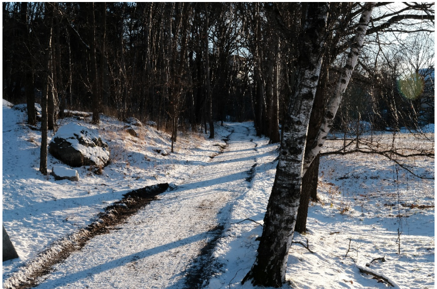
Bild 2. Entrén till skogsområdet från Älvsjöbadet.

Parkvägen består av grus och stenmjöl och förvaltningen snöröjer den vintertid men den saknar belysning. Den ligger inom parkmark, som förvaltningen ansvarar för, men det är trafikkontoret som ansvarar för belysning utmed parkvägar. De ansvarar även för planering av stadens cykelvägar.