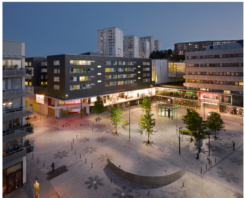
Exempel på god överblickbarhet: Liljeholmstorget.