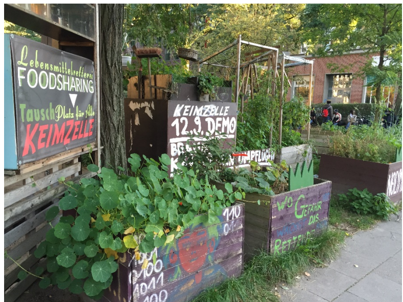
Exempel på medborgarinitiativ: Stadsodling i Hamburg.