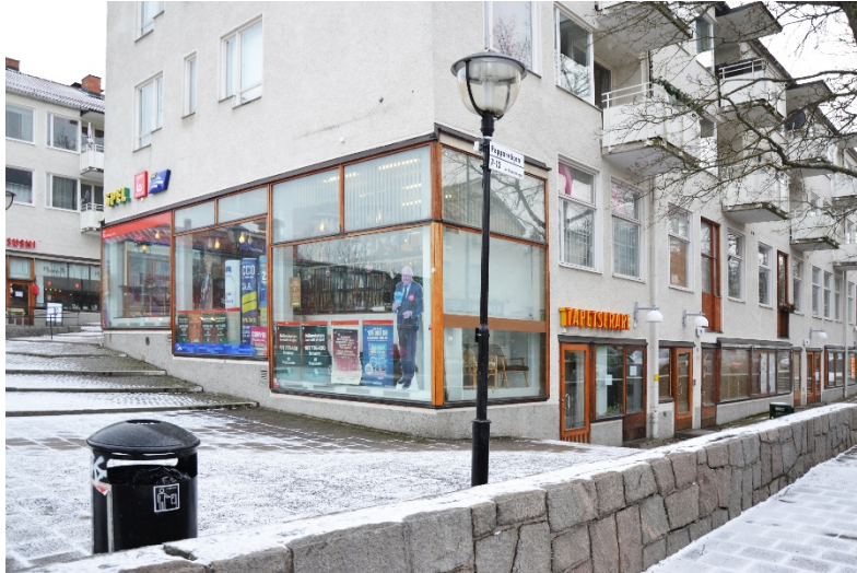
Exempel på öppna fasader: Hökarängen.