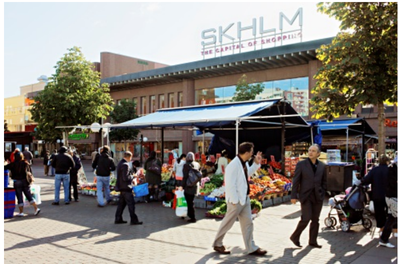
Exempel på tillfälliga aktiviteter: Skärholmen.