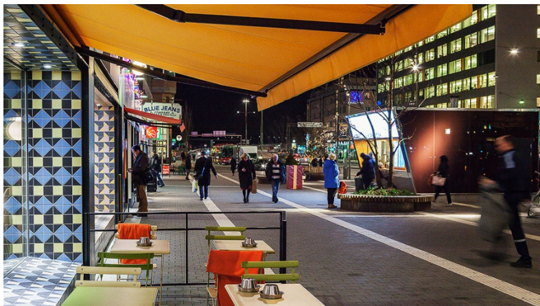
Exempel på variation: Hornstull.