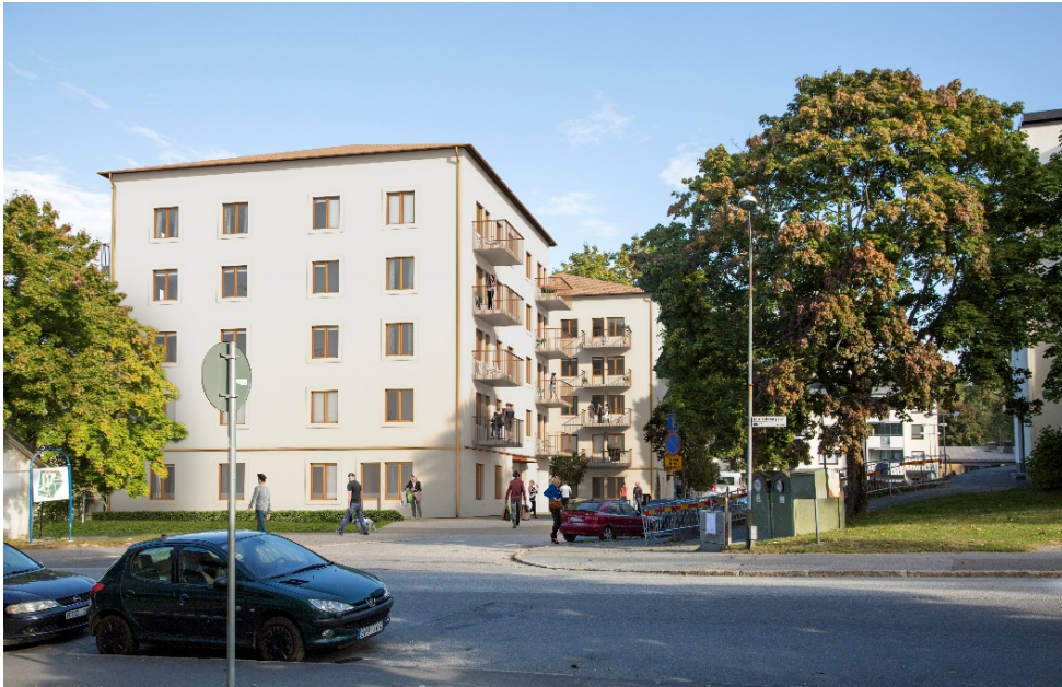
Vy in mot Kilsgatan