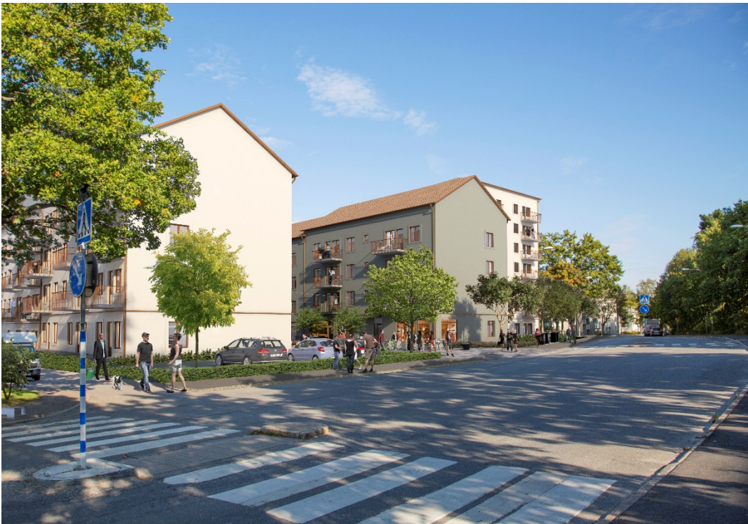
Utblicken från korsningen Kristinehamnsgatan – Sunneplan