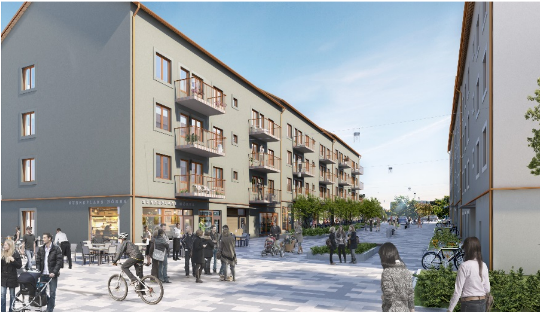
Gångfartsgata mellan lamellhusen