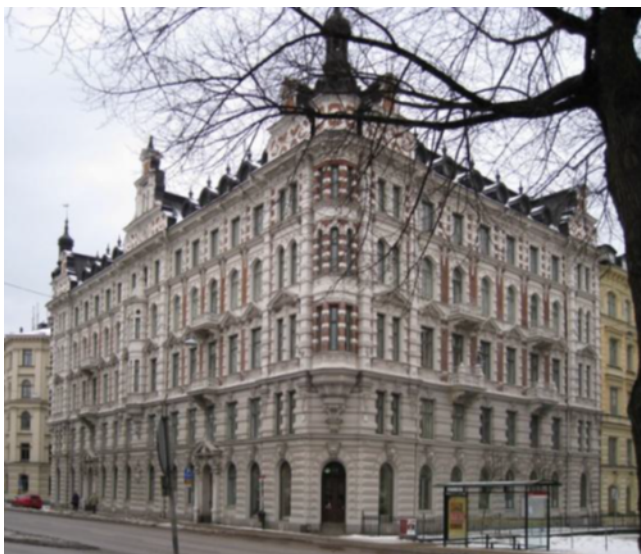
Fasad mot Vallhallavägen och Floragatan