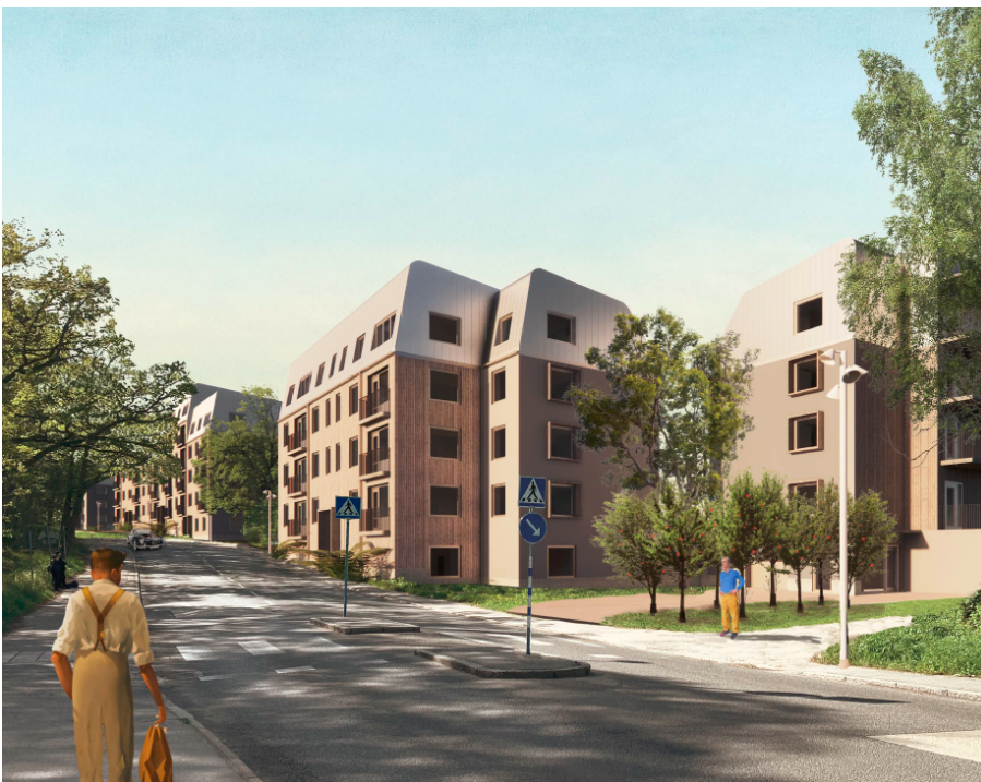
Vy från Gubbkärrsvägen sett från norr