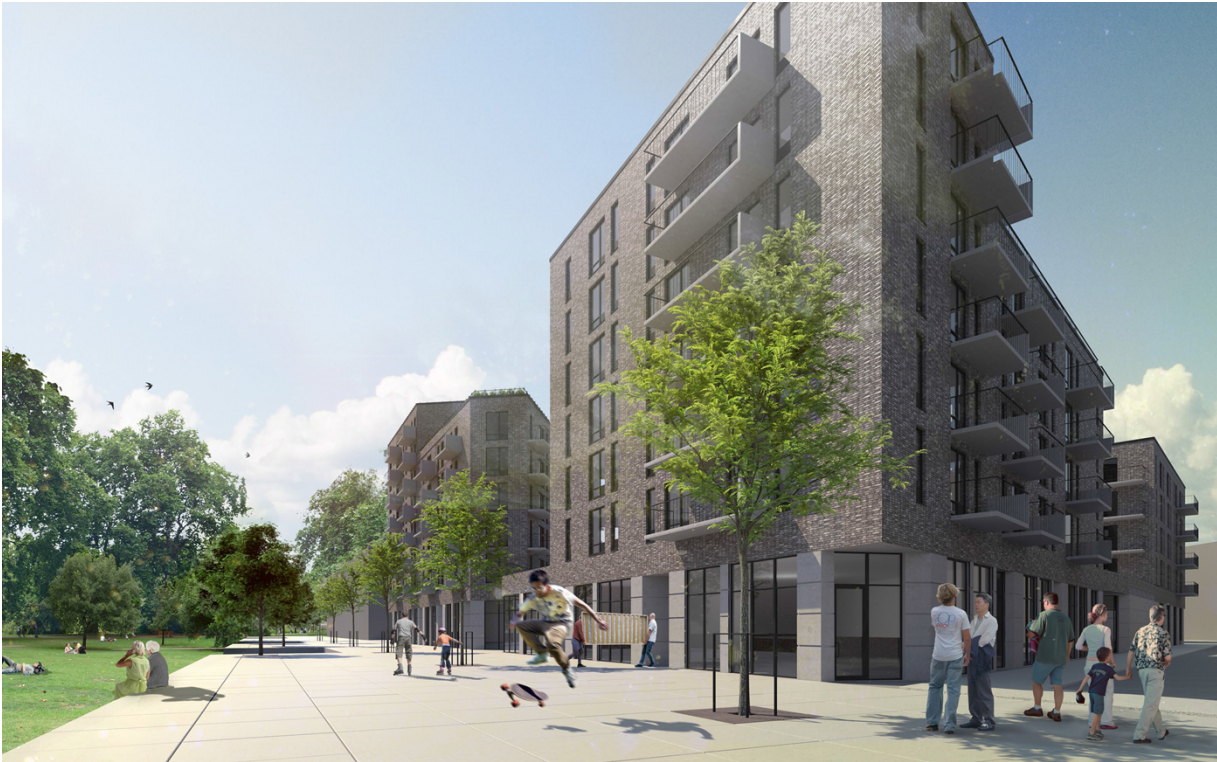
Vy från parken