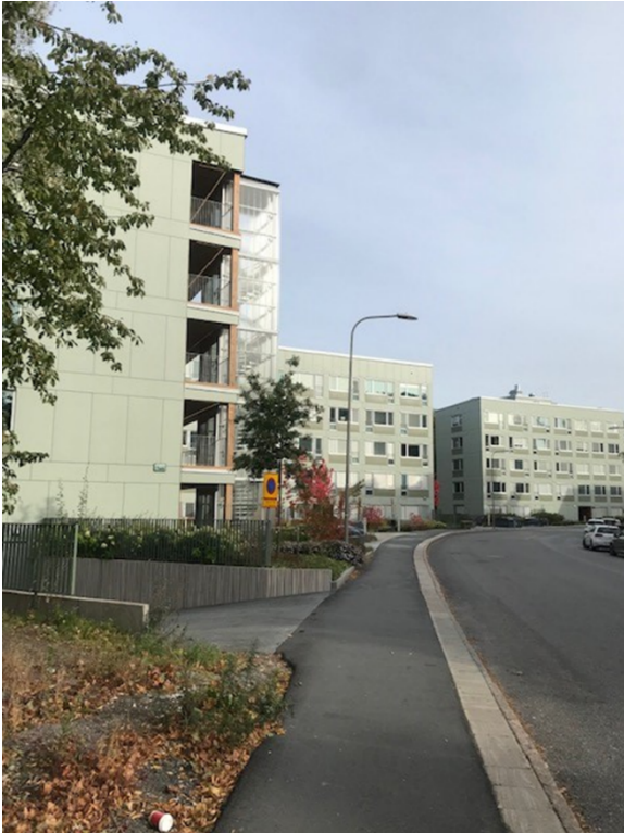
Vy från Bjursåtravägen