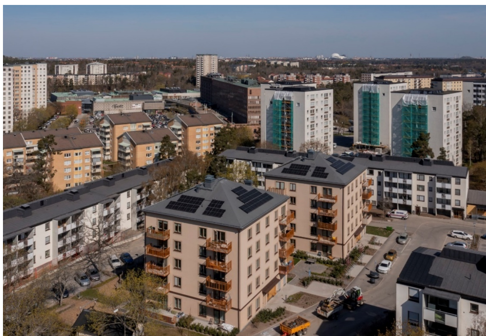
Drönarbild över Kilsgratan.