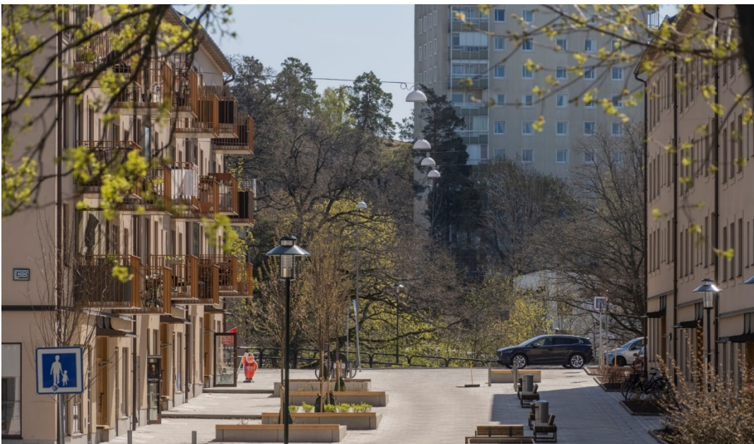
Gångfartsgata mellan lamellhusen.