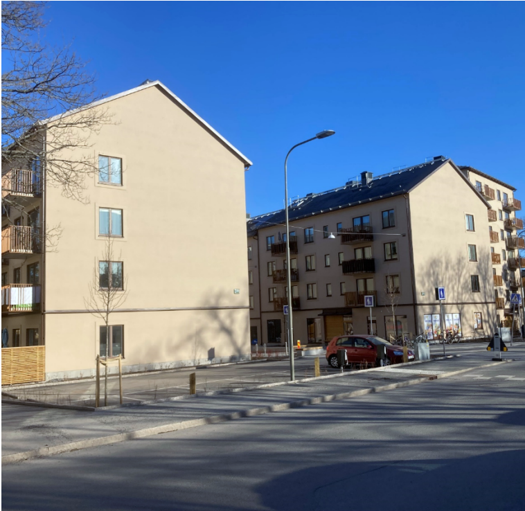
Korsningen Kristinehamnsgatan – Sunneplan