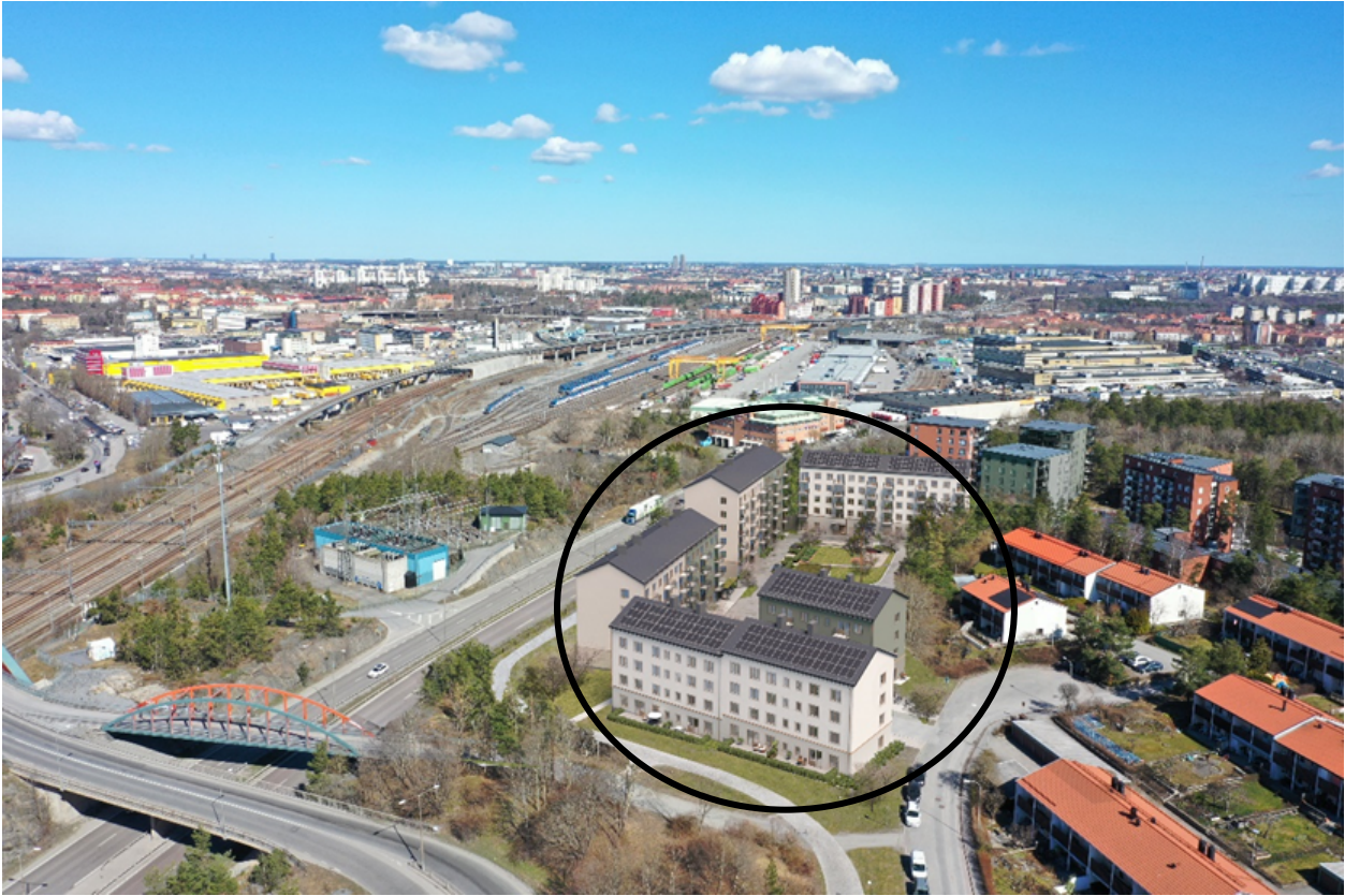
Visionsbild över området