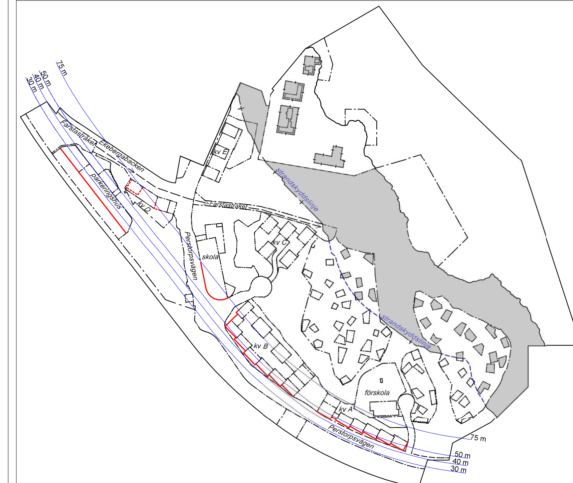
Illustration. Strandskyddet upphävs inom gränsmarkade områden. Fasader med röd heldragen linje omfattas i sin helhet av riskåtgärder avseende fönsterglas. Fasader med röd streckad linje som ligger över parkeringshusets nockhöjd omfattas av riskåtgärder avseende fönsterglas. Mörkblå heldragna linjer markerar avståndet från Nynäsavägens körbanekant. Illustrationen visar också kvarteren såsom kv A, gator, skolor, förskolor, parkeringshus och Farstastråket.