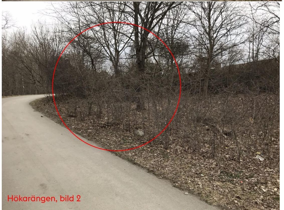
Hökarängen, bild 2