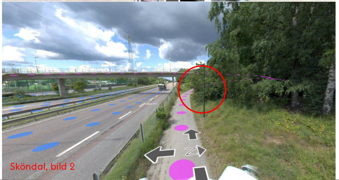
Sköndal, bild 2