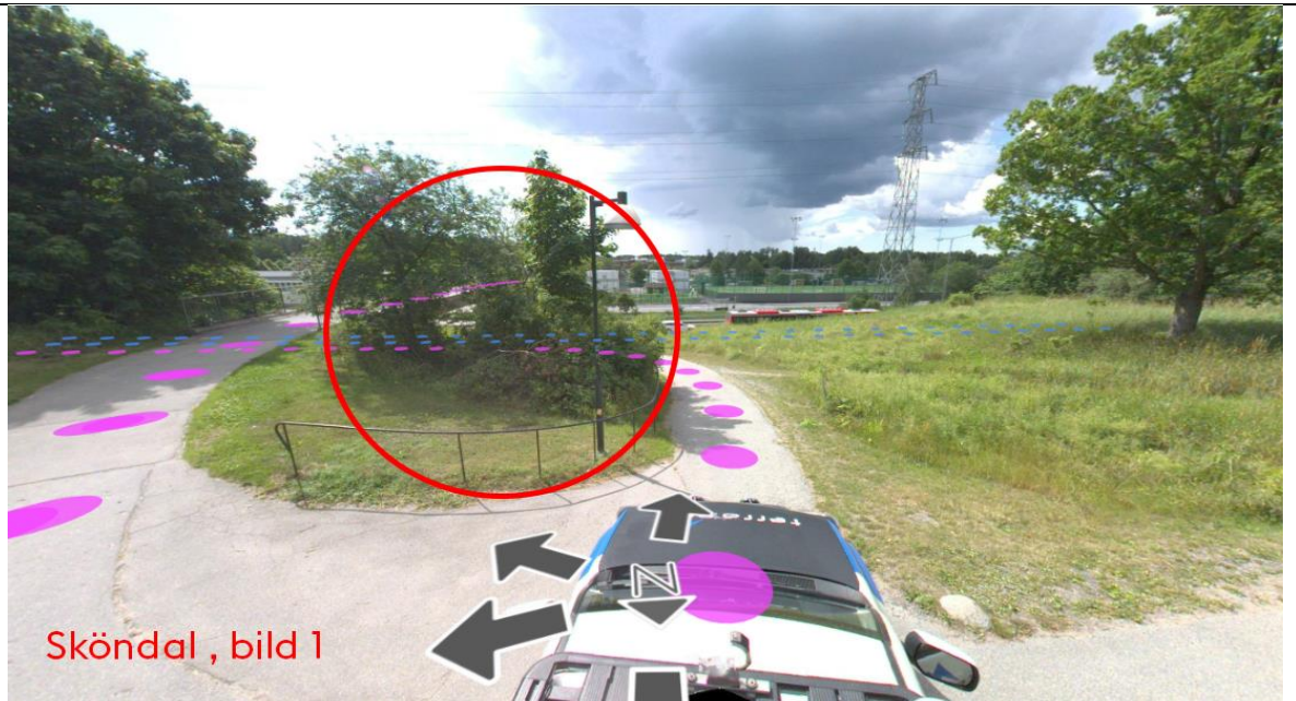
Sköndal , bild 1