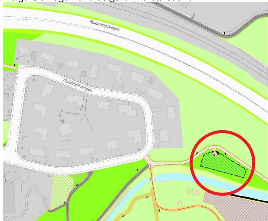
Bilden visar placering och utformning av befintlig hundrastgård i Farsta strand

Farsta stadsdelsförvaltning Stadsutveckling