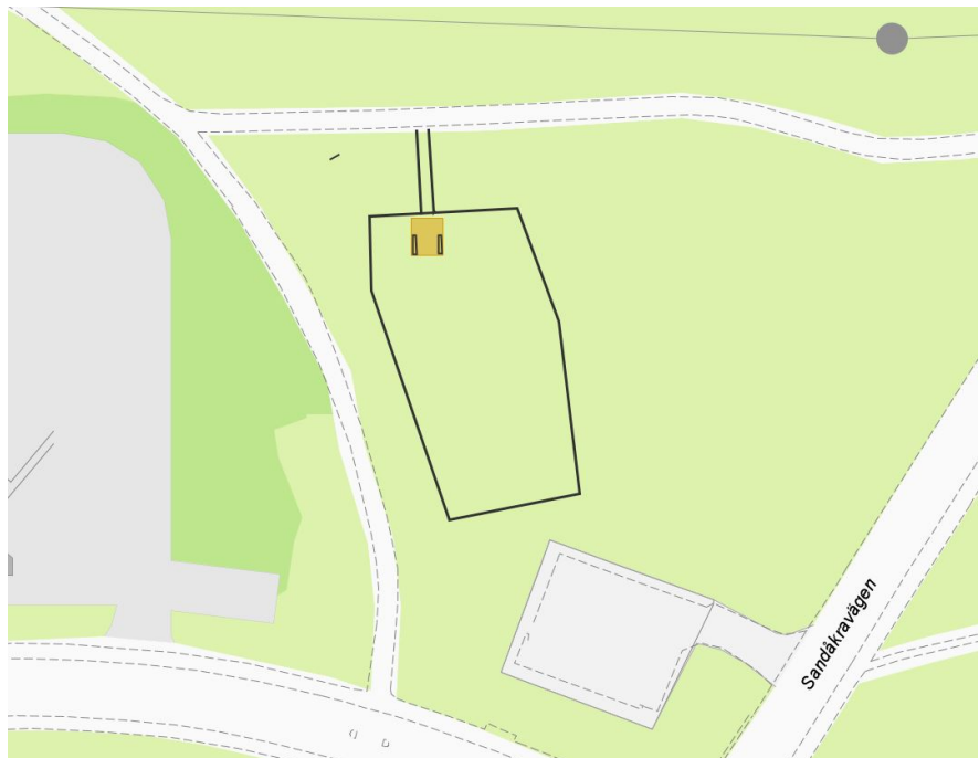
Bilden visar skiss på ny hundrastgård i Sköndal