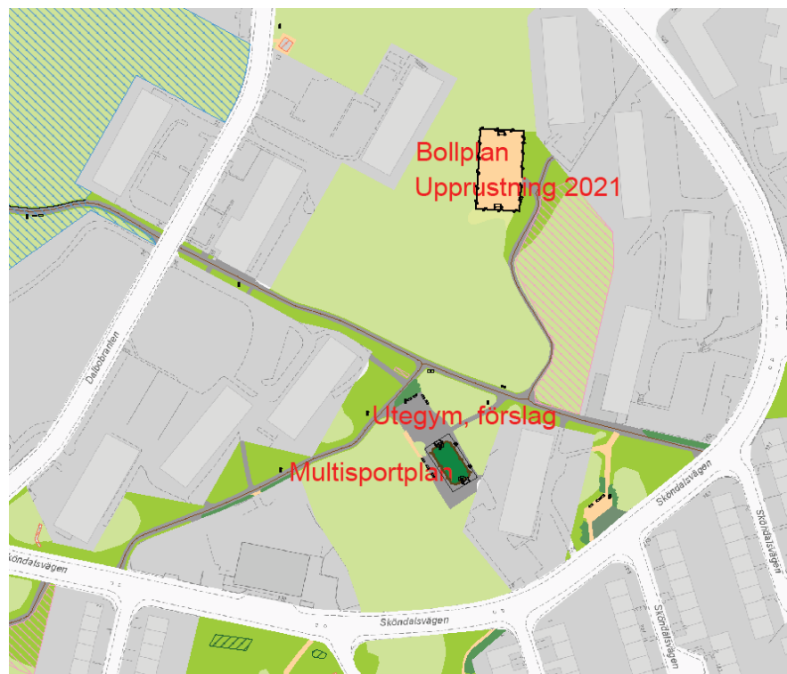
Naturmarksområdet mellan Sköndalsvägen och Dalbobranten

Förvaltningens alternativ är istället en plats cirka 100 meter söder om föreslagen bollplan. Där finns en multisportplan och en asfaltsyta med några bänkar och en uppmålad yta för bollspel. Förvaltningen tror att platsen lämpar sig väl för ett senioranpassat utegym. Förutom gymredskap föreslår förvaltningen att platsen kompletteras med ett par bord till befintliga bänkar. Eventuellt kan även en grill rymmas på platsen. Markbeläggningen byts ut mot grus eller annat genomsläppligt material.