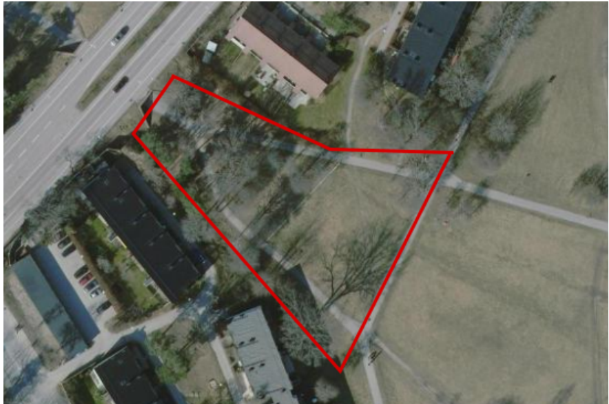
Etapp 3, Mötesträdgården, projektområdet markerat med röd linje. Gångtunneln under Farstavägen syns i övre vänstra hörnet.

Gestaltningen av platsen plockar upp temat med hexagoner i markbeläggningen från Farstaängens parklek. Inom ett antal hexagoner finns plats för grillar, långbord, mindre sittgrupper varav några med möjlighet till schackspel, boulespel, trädäck, pingisbord soffor, en stor hammock och ett stort valnötsträd som platsens vårdträd. Linspänd belysning med varmt sken hänger som en krona över mötesplatsen. I gräsytan som omger hexagonerna finns en låg buskplantering, flera nya träd och solstolar. Alla träd planteras i växtbäddar med biokol vilket ger goda förutsättningar för träden att frodas.