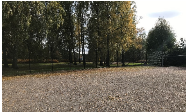
Del av Olympiaplans bollplan

På andra sidan Olympiaplan, tvärs över Lingvägen, finns en bollplan som är 18 gånger 35 meter och som inte används i någon större utsträckning. Den är inte bopningsbar och har grusunderlag. Denna plan är enligt förvaltningen ett bra alternativ när det är många som ska spela boulespel samtidigt. En fördel med bollplanen är att det finns belysning vilket boulesplanen på andra sidan vägen saknar.