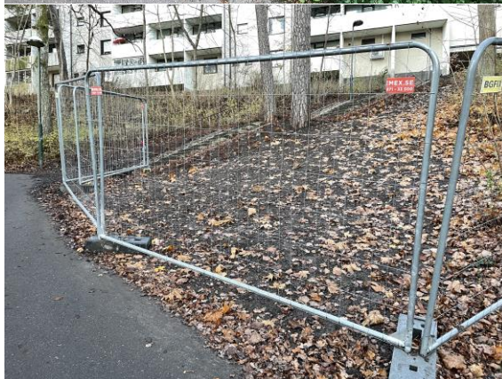
Fagersjö 2 före och efter