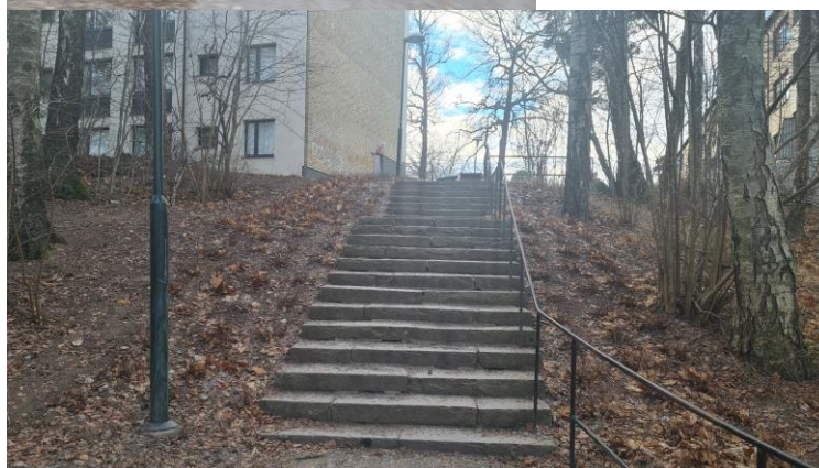
Mårbackagatan före och efter