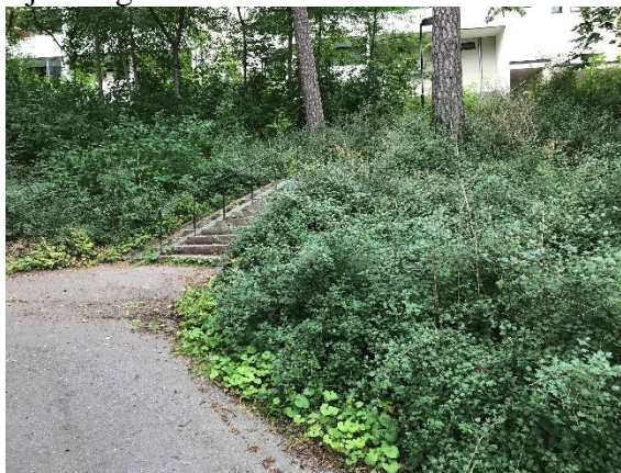
Ejdervägen före och efter