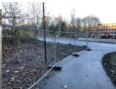
Ölmevägen före och efter