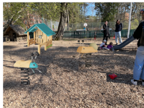
Nytt lekhus och nya gungdjur