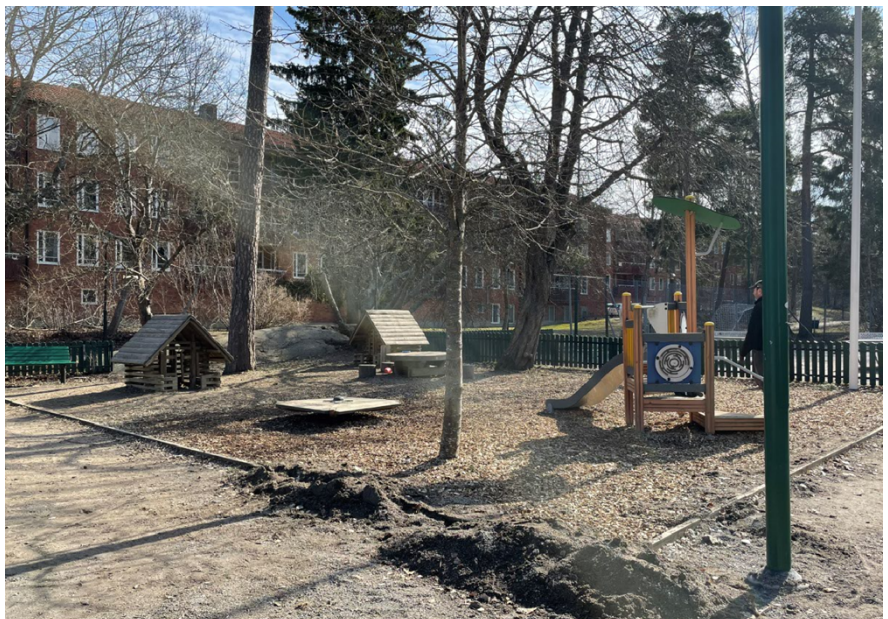
Den södra platsen där vissa lekredskap och fallskyddsunderlag behöver förnyas.