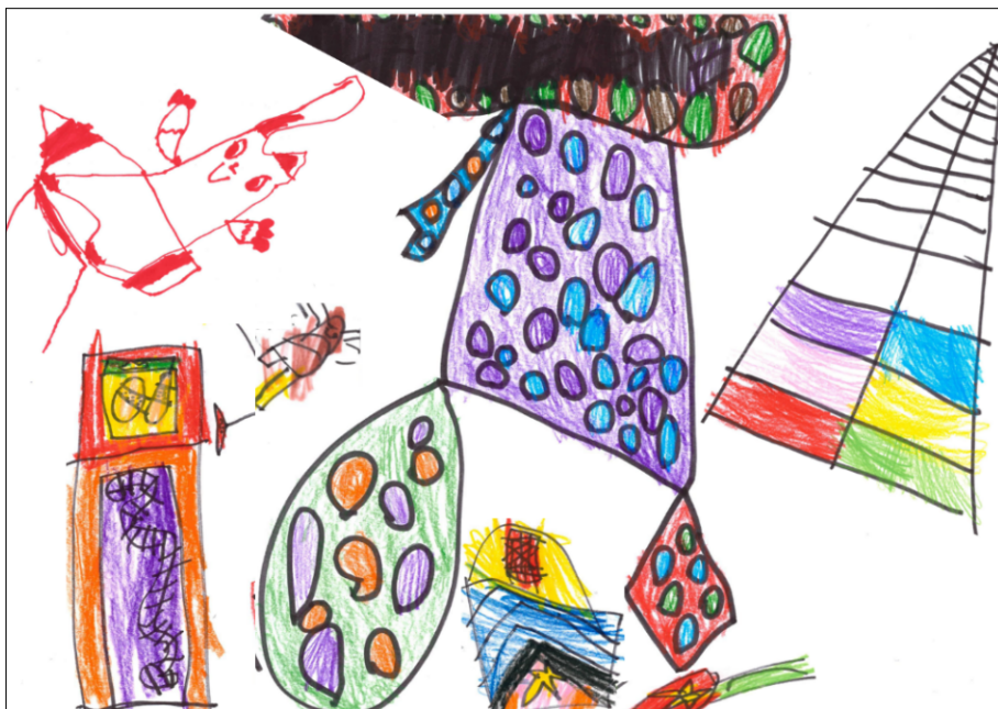
Ett collage av några av de fina teckningar som vi har haft glädjen att ta del av. Skaparna av dessa bilder är Elvira, Stig, Florence och Herman.