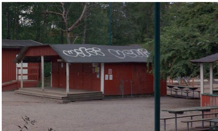
”Linkan-boden” ligger mitt i parken.

Föreningen har ett avtal med förvaltningen att de får nyttja bodarna i lekparken, en större som kallas Linkan-boden och två mindre, mot att föreningen rustar upp bodarna.