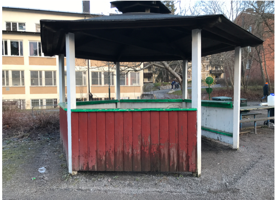
Grillpaviljongen i parken

Grillplatsen används flitigt och är riktigt sliten. Här passade det bättre att höra de vuxnas aspekter på grillplatsen än barnens.