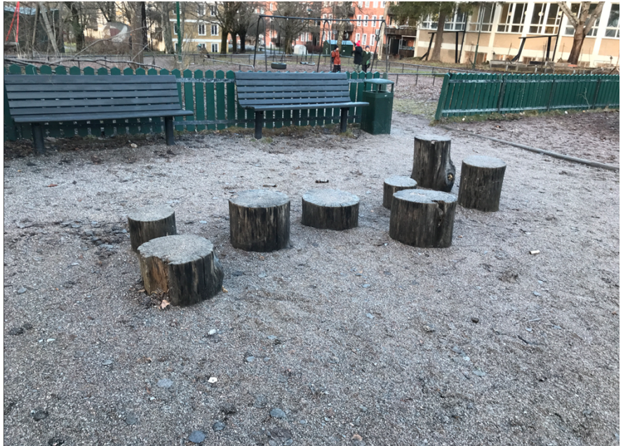
Den norra platsen där balansstubbarna är spruckna och trasiga.