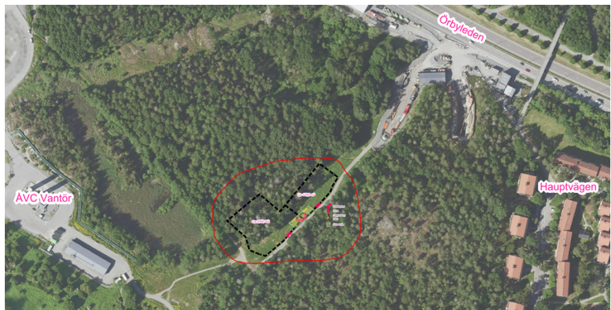
Bild som visar placering av hundrastgården i Hökarängen.