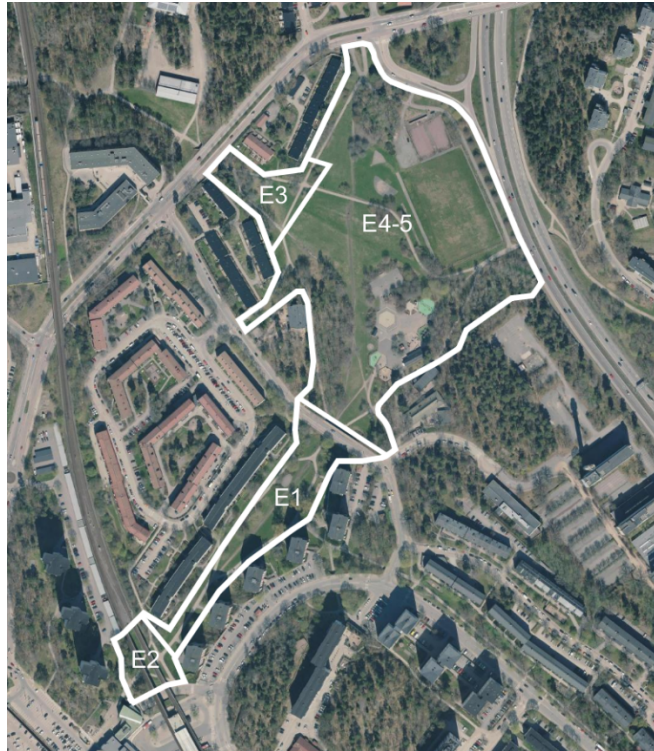
Etappindelning av projekt Farstaängen.

fastställdes av stadsdelsnämnden den 23 maj 2019. Etapperna 1-3 är genomförda. De avslutande etapperna 4-5 omfattar den stora öppna delen av parken och planeras att påbörjas under 2026.