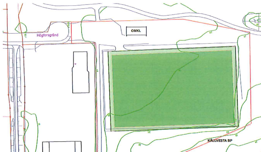
Bilden visar en situationsplan för Kälvesta bollplan med konstgräs och omklädningsbyggnad.