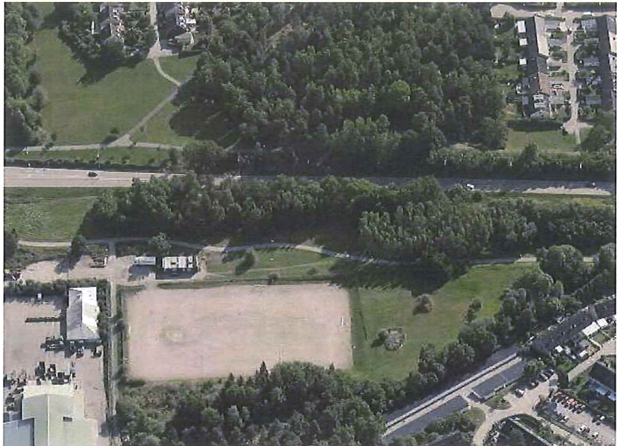
Bilden visar Kälvesta bollplan västerifrån med Bergslagsvägen upptill som binder ihop Spånga-Tensta med Hässelby-Vällingby.

I stadens budget för 2018 går att läsa att alla barn oavsett bakgrund och förutsättningar ska kunna ha möjlighet att idrotta och alla ska kunna känna sig trygga i stadens idrottsanläggningar. Alla som motionerar och idrottar i Stockholm ska göra det utan risk att bli utsatta för våld och utan att behöva uppleva otrygga miljöer.