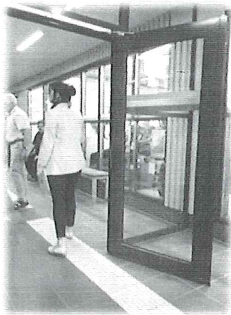
Bild A, ledstråk jämte dörrpost