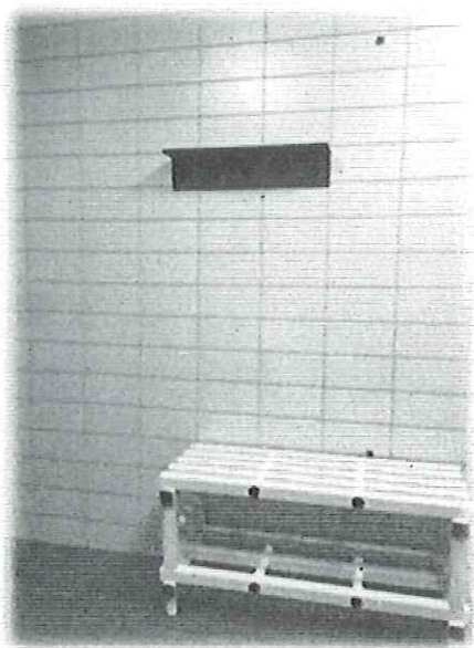
Bild C, högt placerad hylla, avsaknad av lågt placerade krokar