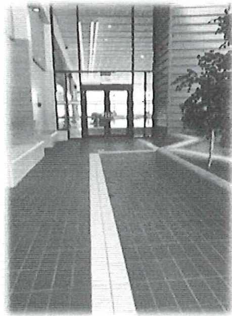
Bild B, visuella ledstråk i simhall