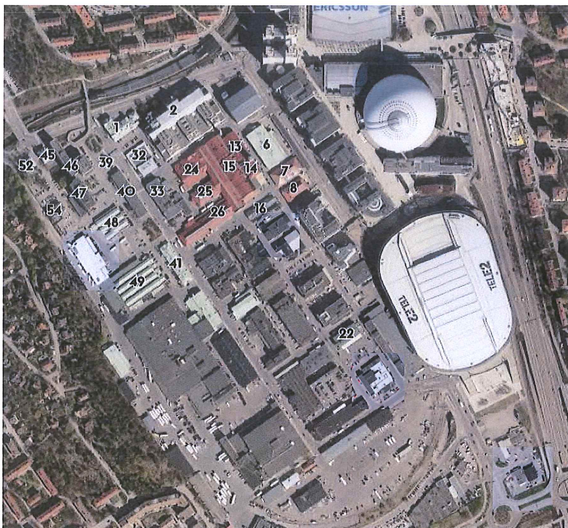
Flygbild över Slakthusområdet. Numrerade hus som ingår i transaktionen framgår.

Försäljning av byggnader, upplåtelse av tomträtter och markanvisningar inom Slakthusområdet i Söderstaden med mera. Två aktieöverlåtelseavtal, det ena mellan Staden och Atrium Ljungberg AB, och det andra mellan S:t Erik Markutveckling AB och staden å den