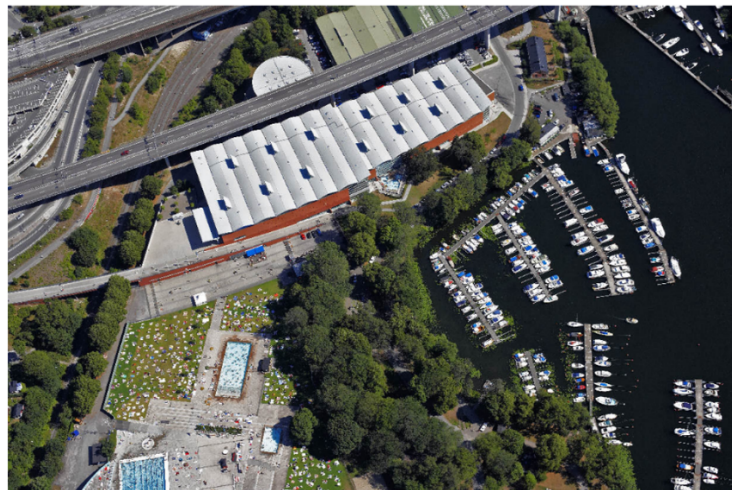
Flygfoto över Eriksdalsbadet

Fastighetskontoret Fastighetsavdelningen